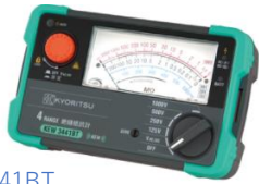
共立電気計器(株) 絶縁抵抗計 KEW3441BT

測定記録支援システム「BLuE（ブルー）」は、無線通信（Bluetooth等）で繋がった測定器から送信されてくる測定値を、PDF図面やExcel帳票へダイレクトに入力することができるソフトウェアです。