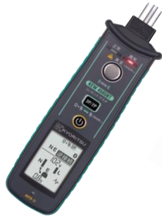
共立電気計器(株) コンセントテスト KEW4505BT

測定記録支援システム「BLuE（ブルー）」は、無線通信（Bluetooth等）で繋がった測定器から送信されてくる測定値を、PDF図面やExcel帳票へダイレクトに入力することができるソフトウェアです。