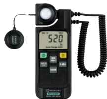
共立電気計器(株) 照度計 KEW5204BT

測定記録支援システム「BLuE（ブルー）」は、無線通信（Bluetooth等）で繋がった測定器から送信されてくる測定値を、PDF図面やExcel帳票へダイレクトに入力することができるソフトウェアです。